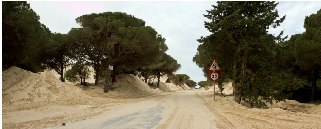
Foto 89. Repoblaciones de pinos sobre las dunas de la ensenada de Valdevaqueros. En la imagen se aprecia cómo los árboles son enterrados literalmente por el avance de la arena.

Incluso con la introducción en los últimos años de elementos artificiales como los parques eólicos en las colinas situadas más en el interior, los nuevos desarrollos urbanos aparecidos tras la retirada de la fuerte presencia militar, y el creciente auge de las actividades náuticas de vela, hoy en día este sector continúa teniendo un sesgo natural muy marcado que lo hace especialmente atractivo para realizar distintas actividades recreativas y de esparcimiento en su entorno.