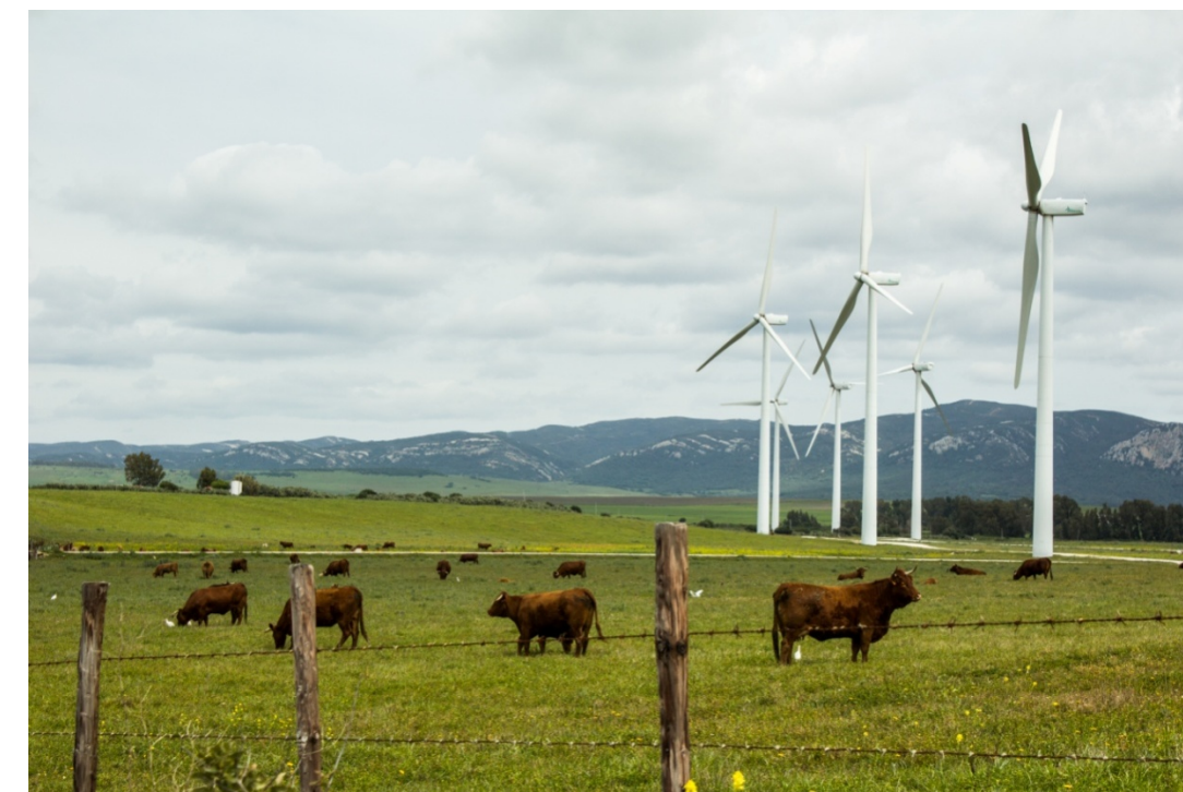
Foto 88. Escena muy repetida a lo largo de la tipología paisajística que se analiza, en la que se combinan los pastos, las manchas de bosque mediterráneo en los enclaves escarpados y los aprovechamientos eólicos.