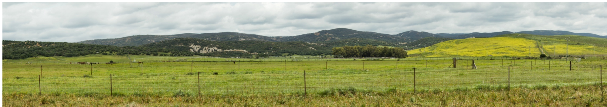
Foto 87. Pequeño pasillo situado entre la antigua laguna de La Janda y la Sierra del Alibe, telón de fondo de la escena.

Este valor ambiental queda refrendado en la actualidad con la protección de numerosos espacios bajo alguna figura de protección legal o por la incorporación en alguna lista internacional que recoge los lugares de mayor valor ambiental a nivel mundial. Es el caso del Parque Natural del Estrecho o el de Los Alcornocales, protegidos por la legislación andaluza pero incorporados ambos a la lista de Reserva de la Biosfera e integrados en un parque natural internacional al compartir determinadas cualidades naturales con el Rif marroquí. En el lado más alejado del Estrecho encontramos, por otra parte, ciertos enclaves de este ámbito en el interior del Parque Natural de La Breña y Marismas del Barbate, la Zona de Especial Conservación Acebuchales de la campiña sur de Cádiz, la Punta de Trafalgar por su tómbolo de especiales características de doble barrera de arena, el río Salado de Conil, el Búnker del Tufillo y del Santuario de la Luz, que albergan una importante comunidad de murciélagos, el río de La Jara en el término de Tarifa, etc. Todo lo cual refleja la biodiversidad y el nivel de conservación que ofrece el territorio que analizamos.