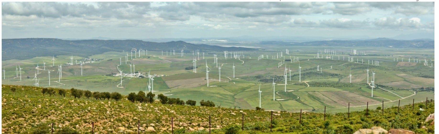
Foto 90. Parques eólicos sobre las lomas de los cultivos de cereal de secano. En la imagen se aprecian los núcleos de El Almarchal y La Zarzuela, dentro del término municipal de Tarifa.

El Estrecho de Gibraltar es el principal paso natural entre el continente europeo y africano y la única puerta de entrada, también natural, entre el océano Atlántico y el mar Mediterráneo. Este importante cruce de caminos a nivel mundial hace de este lugar un