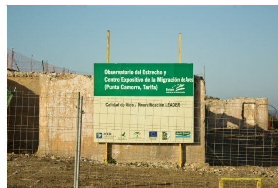
Foto 91. Obras de rehabilitación de un antiguo edificio militar en las proximidades del Estrecho. La finalidad de la obra es crear un observatorio de aves y un centro de exposición permanente sobre la migración de las aves.