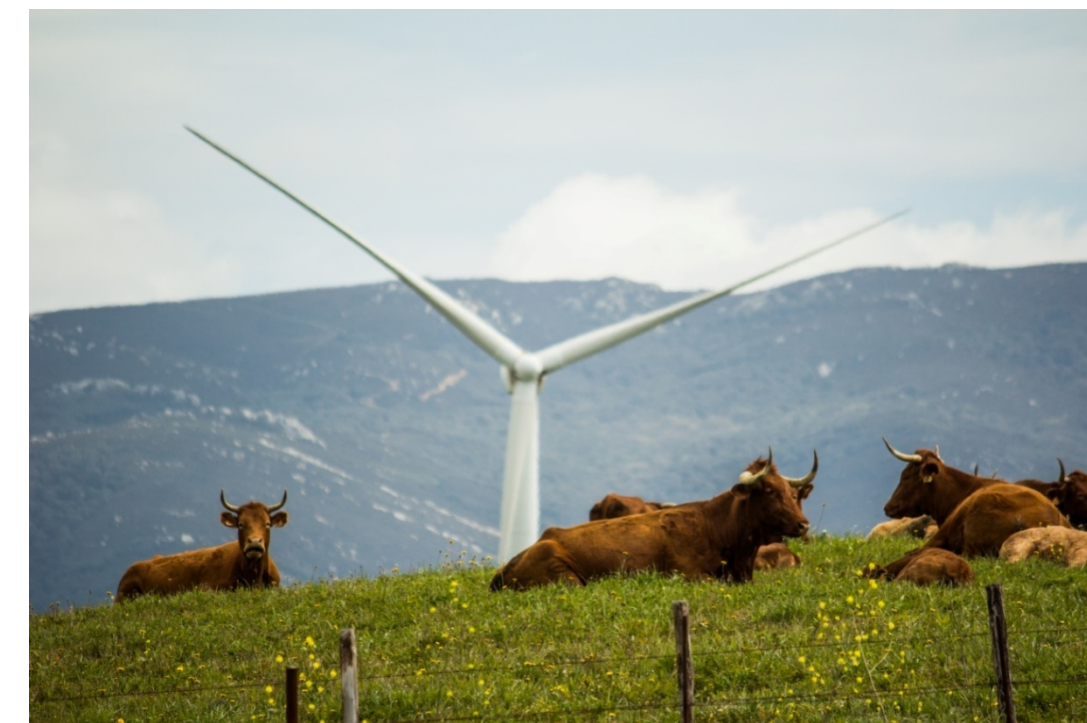
Foto 93. La altura de los aerogeneradores y su ubicación sobre los altos de los cerros y las lomas, los hacen visibles y patentes en todo este territorio. De ahí que sea necesaria la aplicación de planes de ordenación que establezcan medidas concretas para minimizar, en la medida de lo posible el impacto visual que causan.