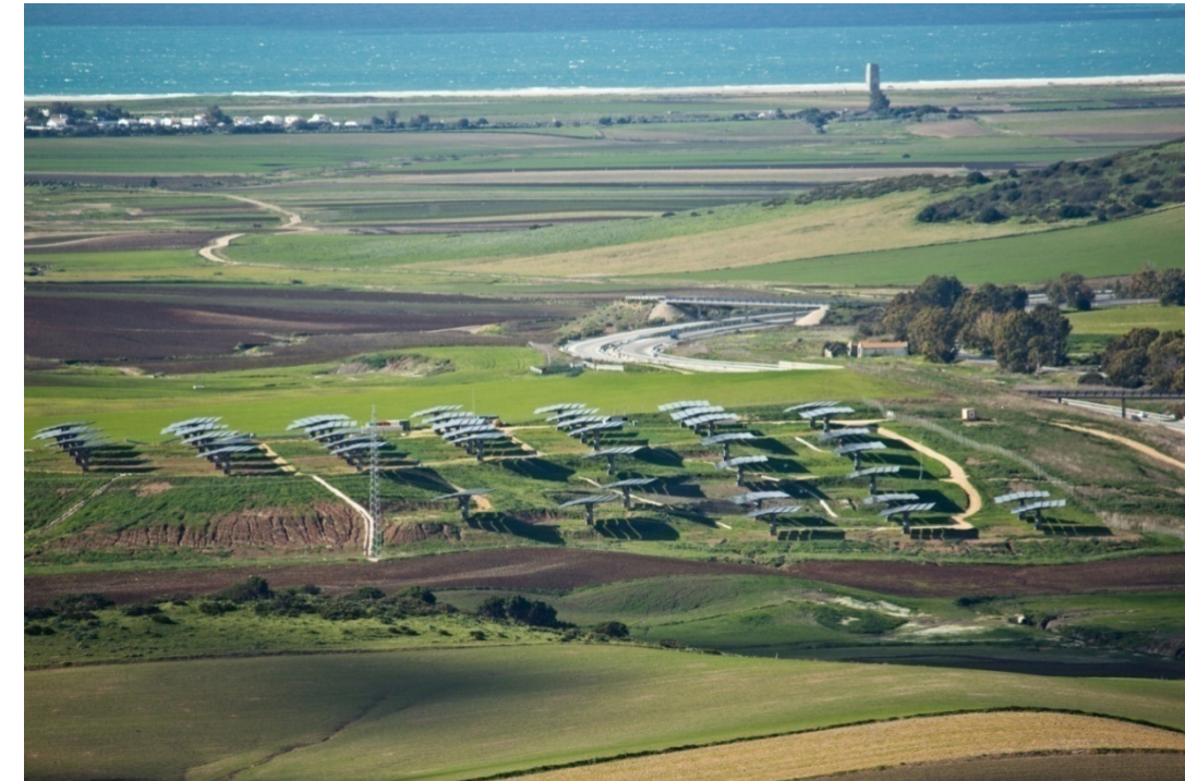
Foto 92. Instalaciones fotovoltaicas en las proximidades de Vejer de la Frontera. A pesar del escaso impacto que tienen sobre el medio físico, desde la perspectiva escénica su ubicación entre la mencionada localidad y el mar las sitúan en una dirección focal muy interesante, introduciéndose como un elemento distorsionador.