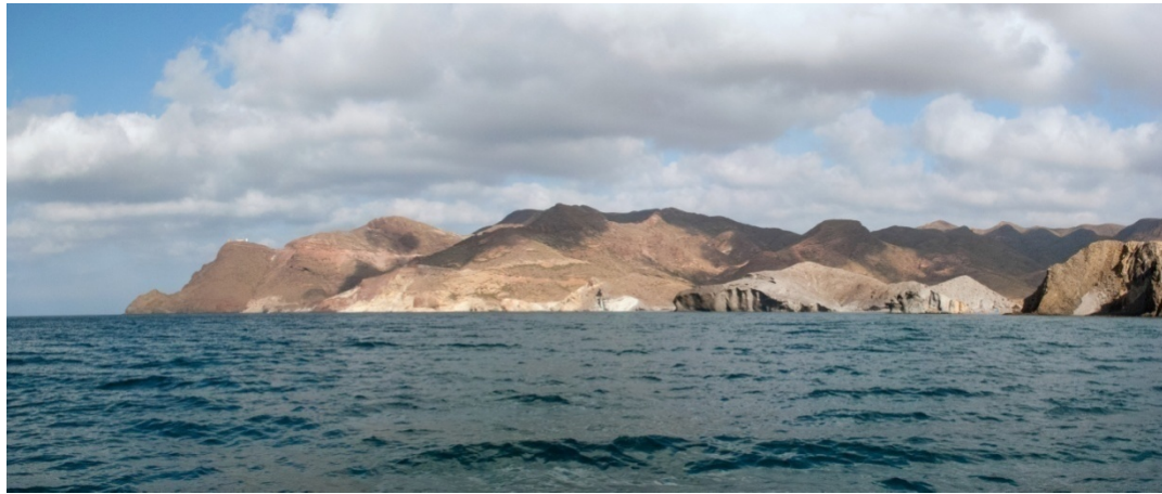
Foto 52. Espacio costero dominado por las rocas volcánicas, una de las singularidades de esta tipología paisajística.