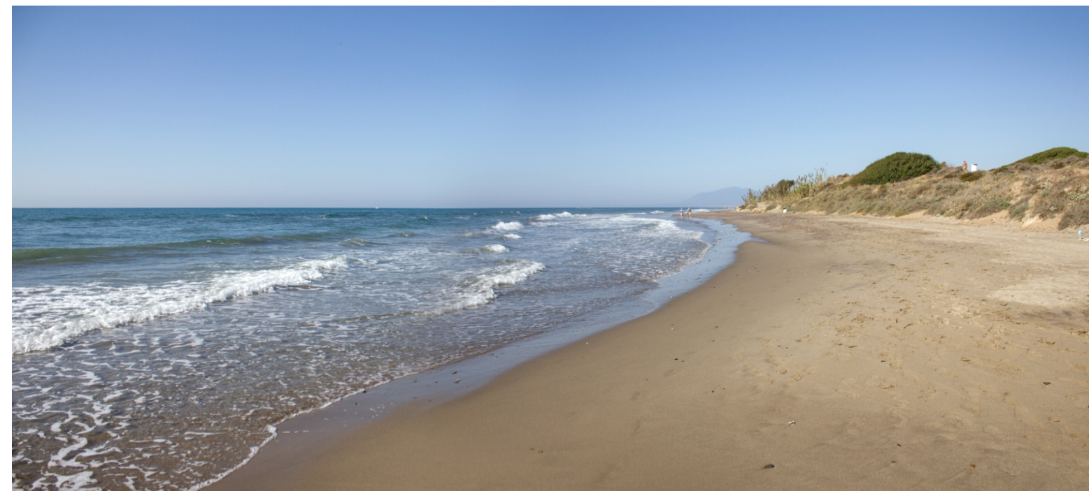
Foto 55. Dunas de Cabopino, en el sector oriental del término de Marbella, Málaga.