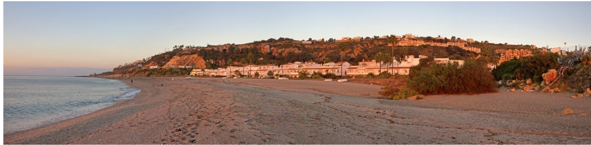
Foto 54. Urbanización Playa Paraiso, Estepona.